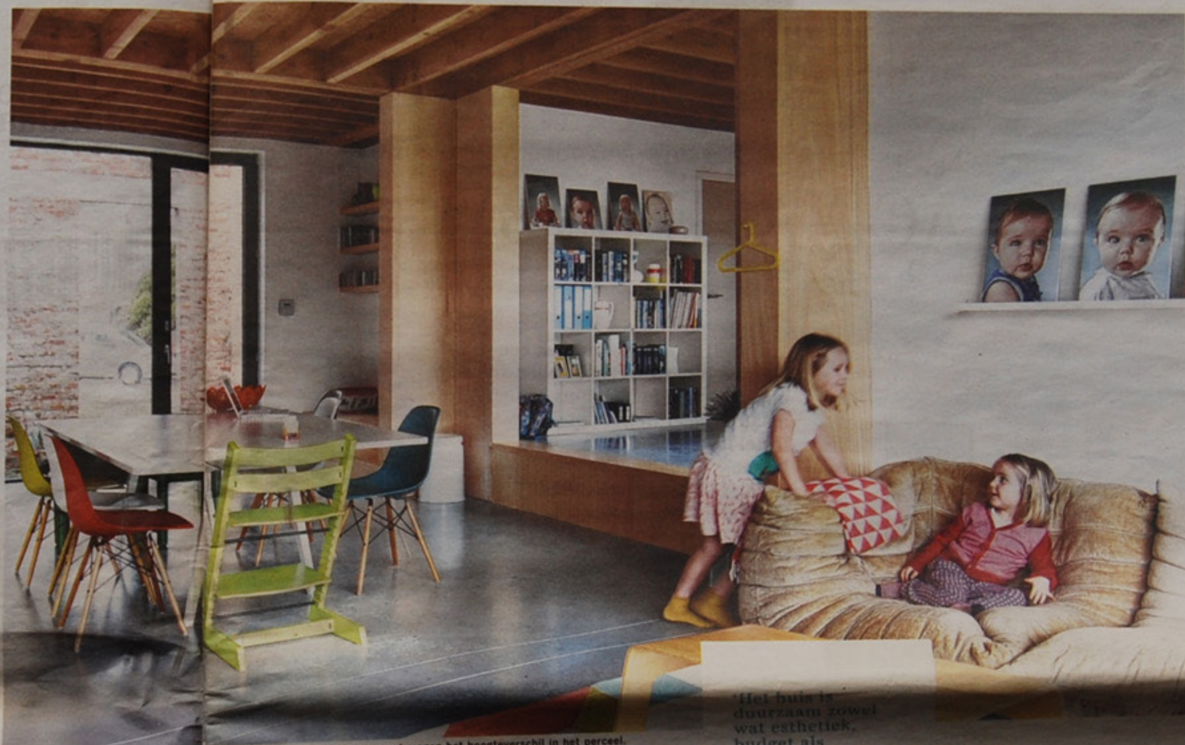
Niveauverschillen binnen overbruggen het hoogteverschil in het perceel.

Die massiviteit fungeert als een soort automatische zonwering. Voorts is ook de luchtdichtheid ver doorgedreven, zodat verwarming op de bovenverdieping tot nu toe zelfs nog niet nodig is geweest. Diederik: 'We hebben voorzieningen getroffen voor zonnepanelen, maar misschien blijkt uit onze jaarlijkse energieafrekening dat die eigenlijk niet zo'n meerwaarde zouden vormen. We wonen hier nog maar sinds vorige zomer, dus we wacht