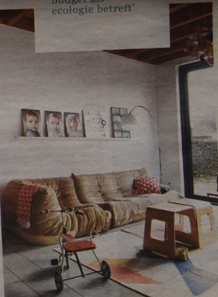
Accessoires zoals de kleurrijke Bau-hanglamp zijn originele accenten.

De bovenverdieping wordt ingepalmd door vier slaapkamers en een grote speelruimte voor de twee dochters. De speelhoek kijkt met een groot raam uit op de patio, zodat je de gemetselde structuur ook binnen goed ziet en voelt. De ruwe bolster maakt het huis tot een nog warmer nest, voor alle bewoners.