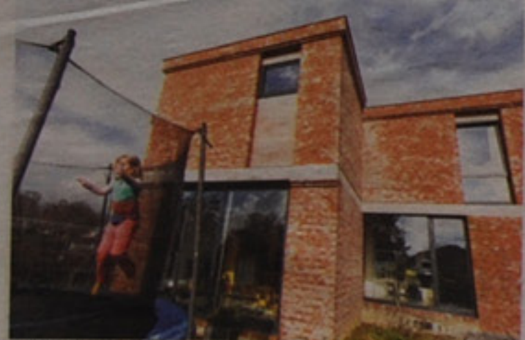
Recuperatiesteen en betonbalken tekenden de gevel.

ELINE MAEYENS FOTO'S LISA VAN DAMME ODE AAN PATRIMONIUM