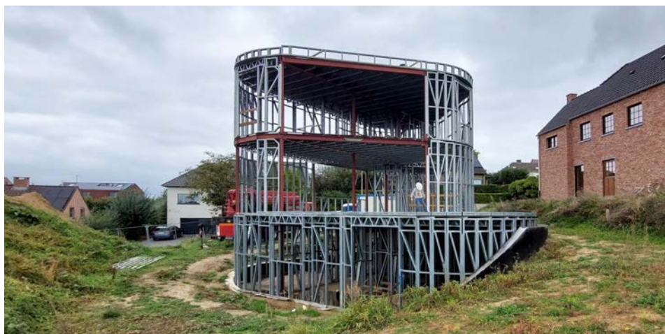
Een organisch vormgegeven ontwerp met steelframe. (Project majeP, BLAF)