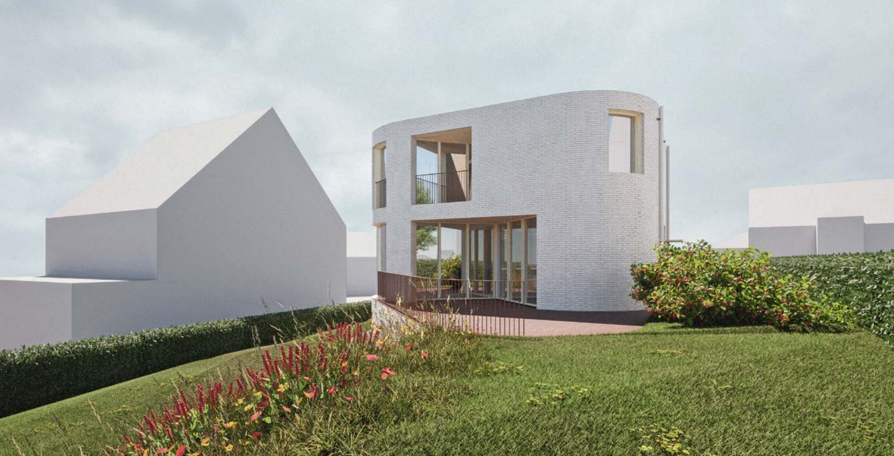
Het ongehinderde uitzicht over de omgeving vormde het uitgangspunt. (Project majeP, BLAF)