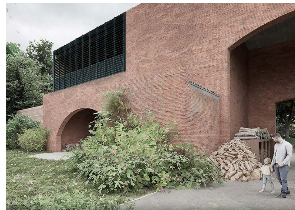
Oud en nieuw in harmonie. (Project 'Schietstand', BLAF)

over de omgeving was het uitgangspunt van dit ontwerp." Met zijn afgeronde driehoekige vorm staat het volume solitair in het landschap, waarbij de onbebouwde grond zoveel mogelijk zijn reliëf behoudt. Respectvolle en onderscheidende architectuur, die inzet op de beleving. En zo hoort het. ●