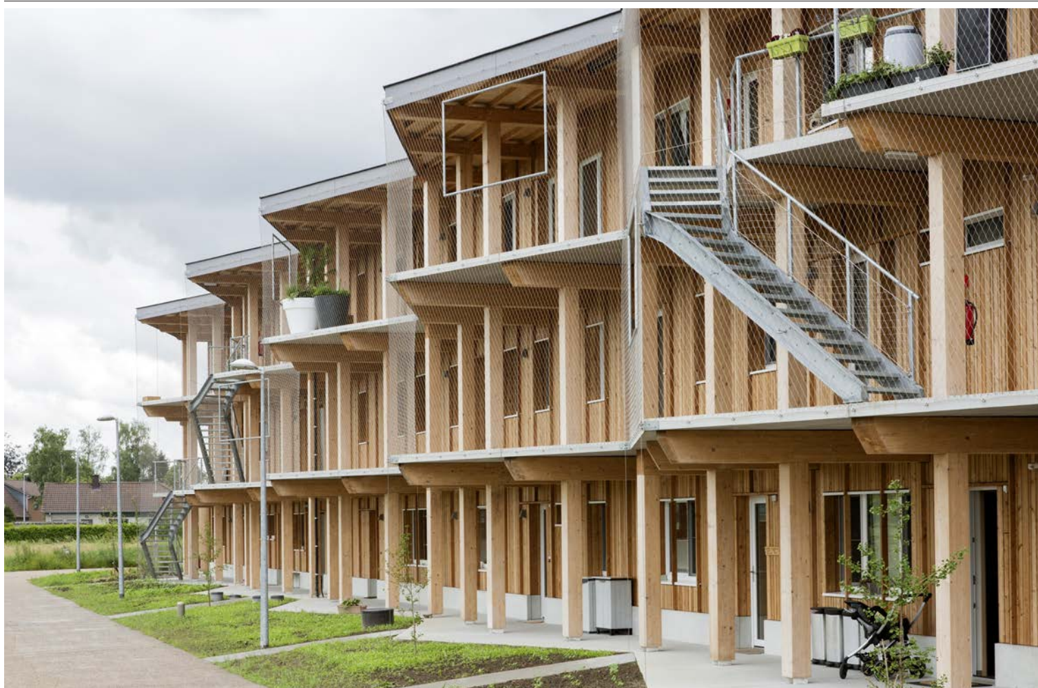
Het grote blok met achttien woonunits ziet er lichtvoetig uit door de speelse houten voorzetconstructie.

22 gezinnen wonen samen in ecologisch en sociaal cohousingproject