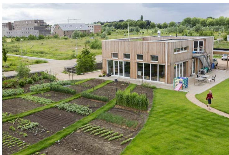
Het paviljoen en de grote tuin zijn gemeenschappelijk .