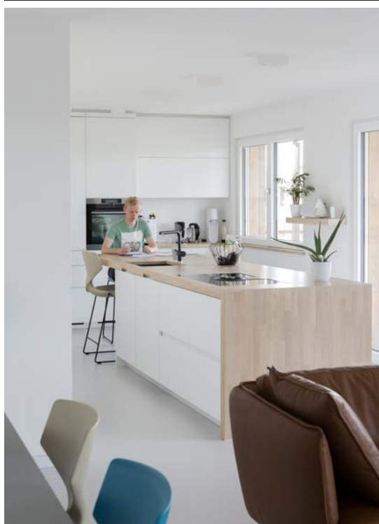
Niels wilde vooral betaalbaar ecologisch bouwen.